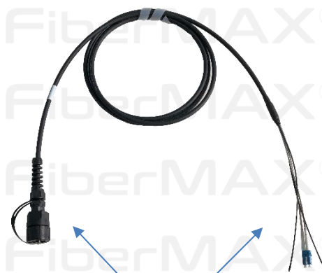
Patchcord dúplex Terminaciones ODVA-LC y CPRI-LC