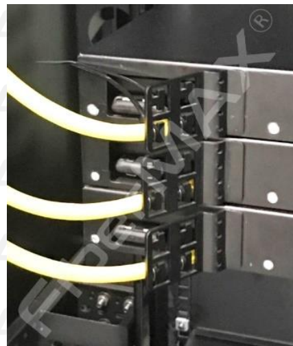
Elemento de fijación posterior lado izquierdo de cables de acometida