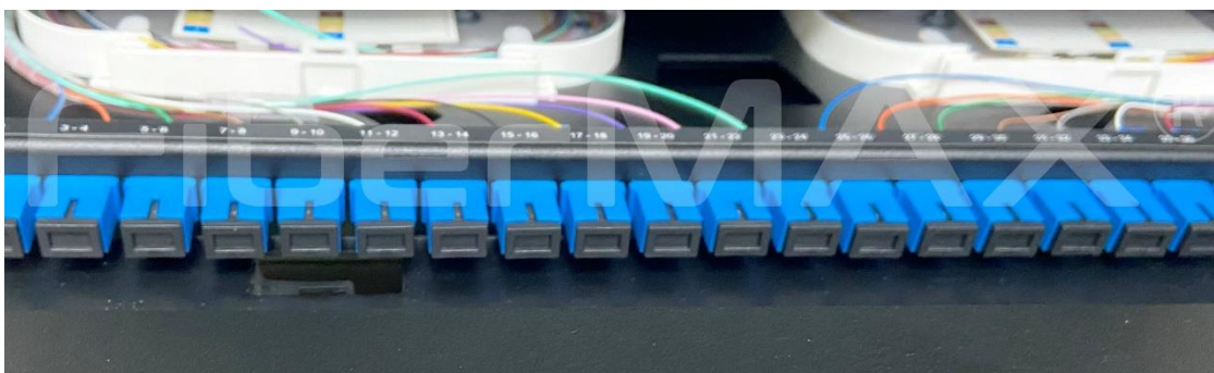
Acoplador SC/UPC, Pigtaills con fibra de colores y bandeja porta-fusiones