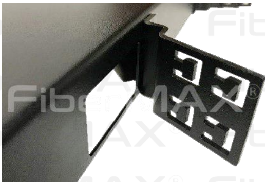
Sujeción de cables posterior